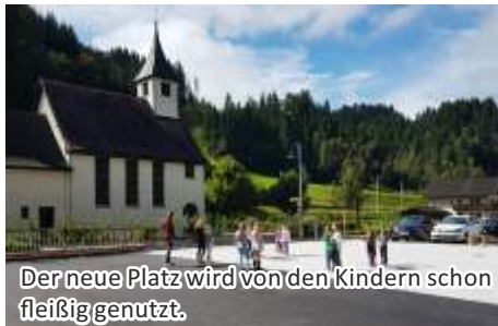
Der neue Platz wird von den Kindern schon fleißig genutzt.

Bauzeitplan wirklich sehr knapp bemessen war. Ich freue mich, dass dieses gemeinsame Bauvorhaben der beiden Gemeinden Bischofshofen und Pfarrwerfen für die Kinder und Jugendlichen und die gesamte Pöhamer Bevölkerung umgesetzt werden konnte.